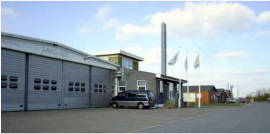
Joka A/S, Industrivej 6 i Vinderup